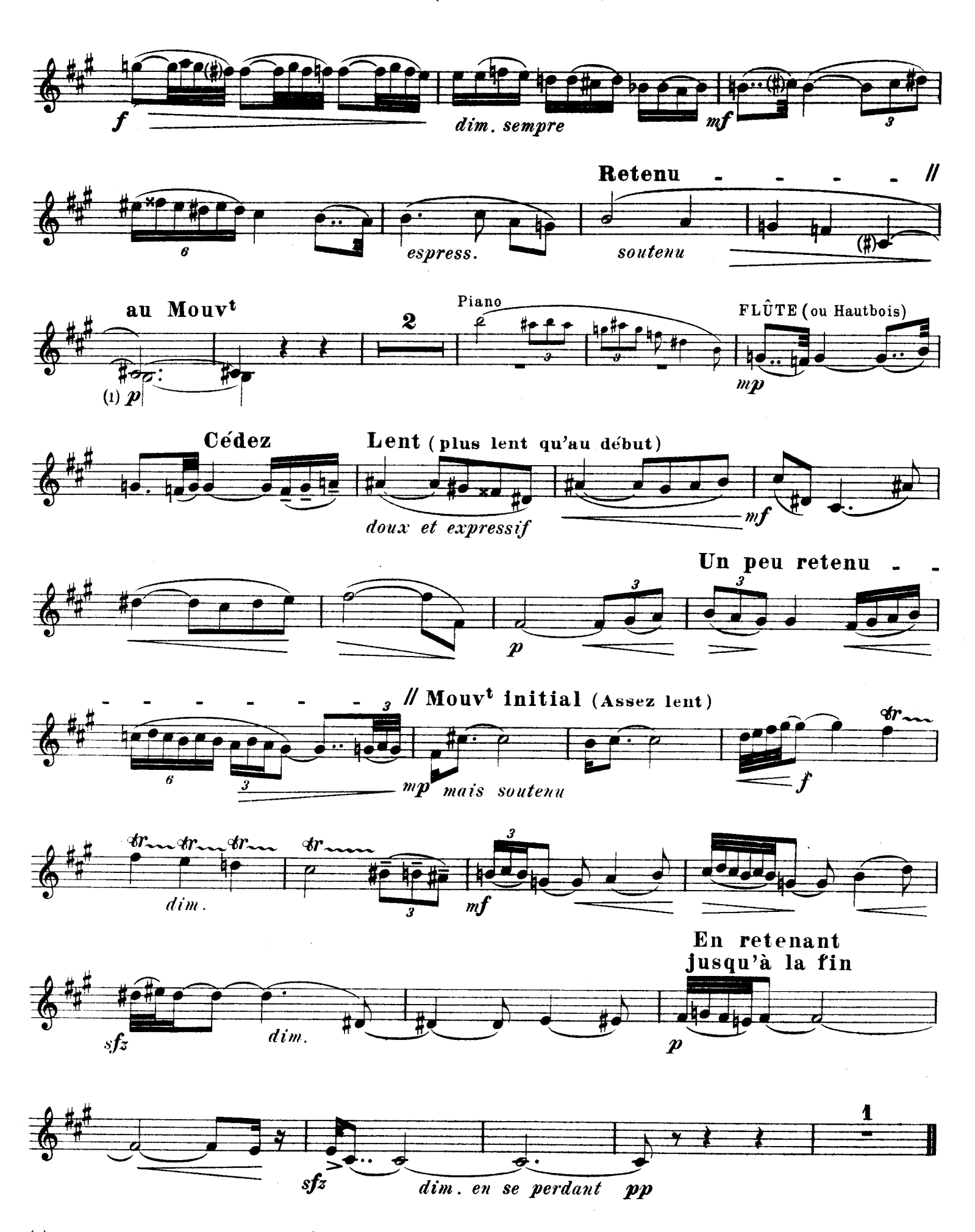
(1) La version inférieure est destinée au Hautbois.